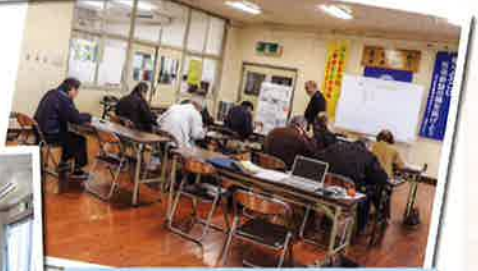
2月木造空き家簡易鑑定士取得講習会