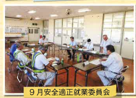
9月 安全適正就業委員会