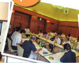
7月職員研修会 (鹿児島市)