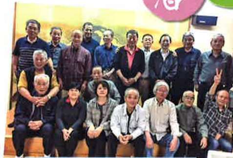
4月クリーンセンター会員親睦会