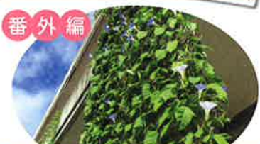
8月センターあさがおグリーンカーテン