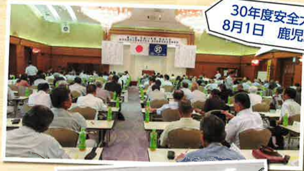
30年度安全大会 8月1日 鹿児島市