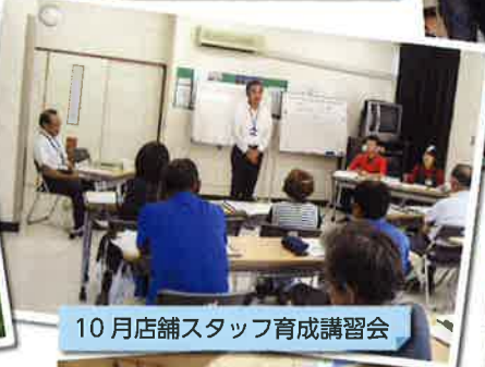
10月店舗スタッフ育成講習会