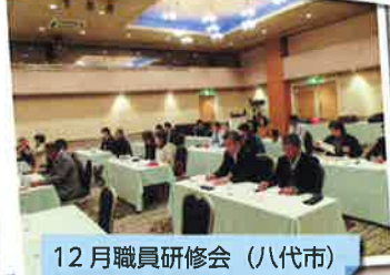
12月職員研修会 (八代市)