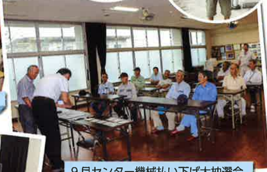
9月センター機械払い下げ大抽選会