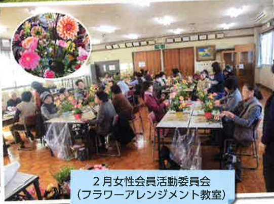
2月女性会員活動委員会 (フラワーアレンジメント教室)