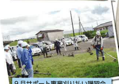
9月サポート事業刈り払い講習会