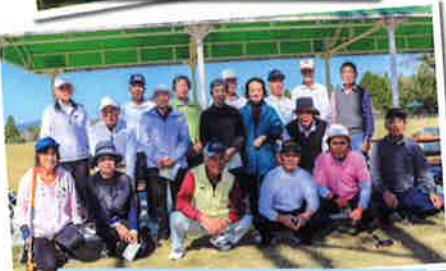
11月グランドゴルフ大会 (樋脇町)