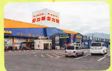
ホームセンタータカミ川内店様

当社は、今後も引き続きシルバー人材センターの方を活用させていただき、地域の皆様に貢献して参りますので、よろしくお願いいたします。