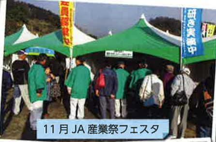
11月JA産業祭フェスタ