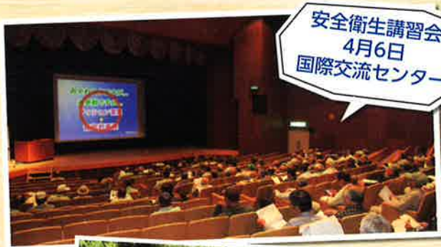
安全衛生講習会 4月6日 国際交流センター