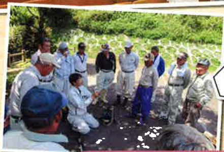
刈り払い機講習会 4月27日 甑地区