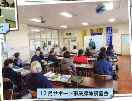
12月サポート事業掃除講習会