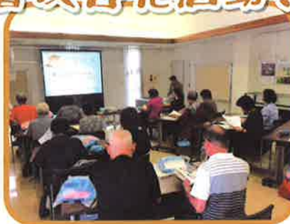
調理補助員養成講習会