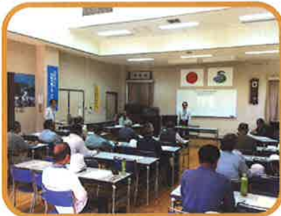
造園技術員養成講習会