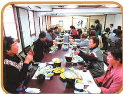
女性会員親睦交流会