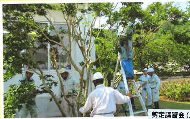
剪定講習会 (上飯地区) (6月)