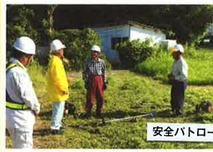
安全パトロール (10月)