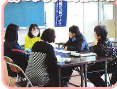
女性会員活動委員会