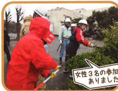
サポート事業剪定講習会