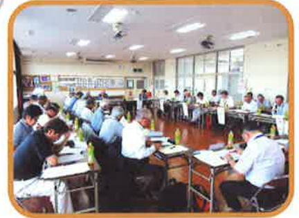
北薩ブロック役員研修会