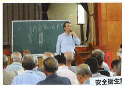
安全衛生講習会 (6月)