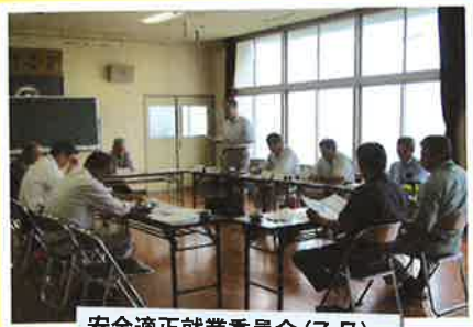
安全適正就業委員会 (7月)

安全就業と会員の健康管理はシルバー事業の最重要事項と位置付け、これまでも安全適正就業委員会を中心に安全パトロールの強化等に取り組んできました。しかし、依然として事故は少なくなるどころか、逆に今年は昨年より増加したところ。このことは、会員一人ひとりが真剣に自覚しないと、いくら外部が声を上げてても効果はないということです。「自分だけは関係ない」といった他人事としないで、是非、自分のこととして「安全衛生講習会」や作業開始前のミーティング及び作業現場の確認を徹底し事故「0」を目指しましょう。