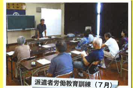
派遣者労働教育訓練 (7月)