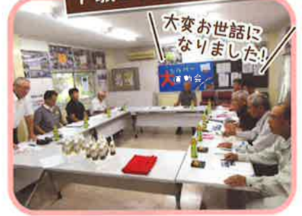
見積もり見直し作業委員会 曾於市SJC先進地研修