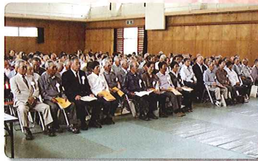
(平成 24 年 5 月 29 日)