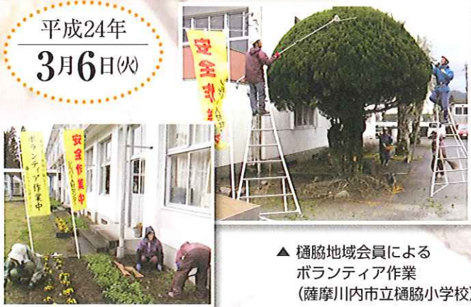
▲ 樋脇地域会員によるボランティア作業 (薩摩川内市立樋脇小学校)