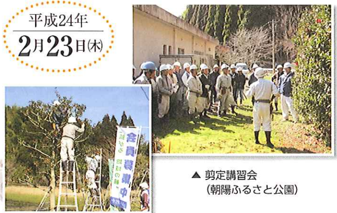
▲ 剪定講習会 (朝陽ふるさと公園)