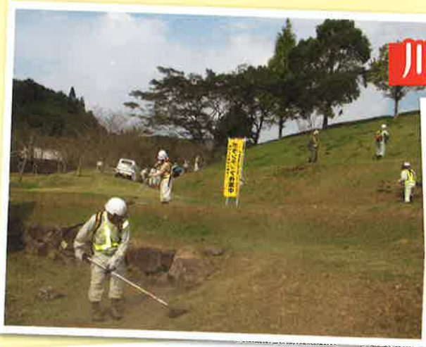
川内地域 10月4日 ○薩摩川内市総合運動公園

地域貢献とシルバー事業の普及啓発を目指して、ボランティア活動を積極的に実施しています。